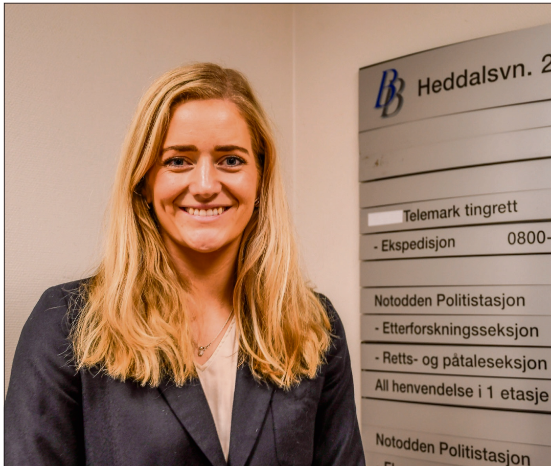
UHELDIG: Justisminister Emilie Enger Mehl (Sp) mener det er uheldig at det som nå er rettssteder ikke har stedlig ledelse. Her ved skiltet hvor ordet Aust måtte tapes over i april da alle tingrettene i Telemark ble til en.

Uansett - Gutta Krutt har bidratt til at Tinfos-lekteren TP135 er nærmere en redningsaksjon. Og for de som ikke har industrihistorien i minnesporene: TP står for Tinfos Papirfabrik og nummeret er altså 135.