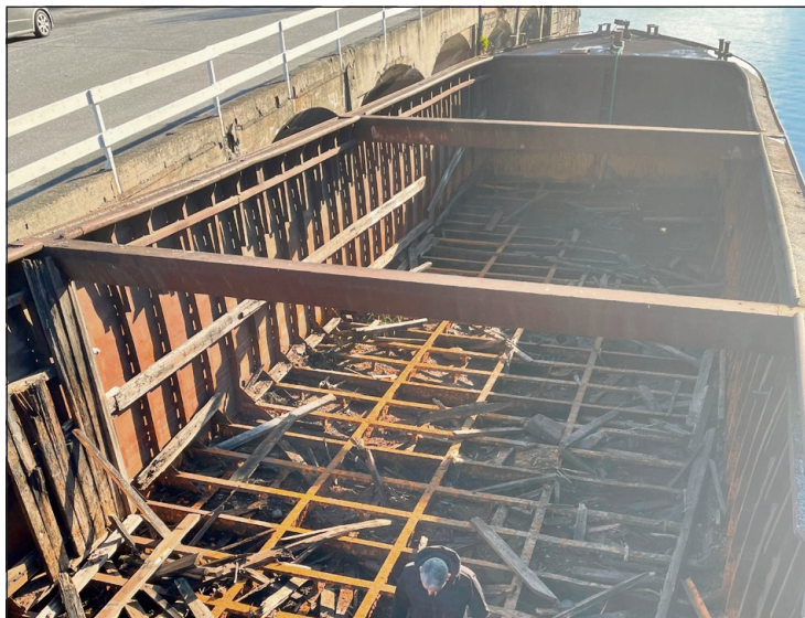
ILLE: Slik så det ut før Gutta Krutt gikk i gang med arbeidet. Trøstløst? Nei, ikke for arbeidslaget Gutta Krutt.